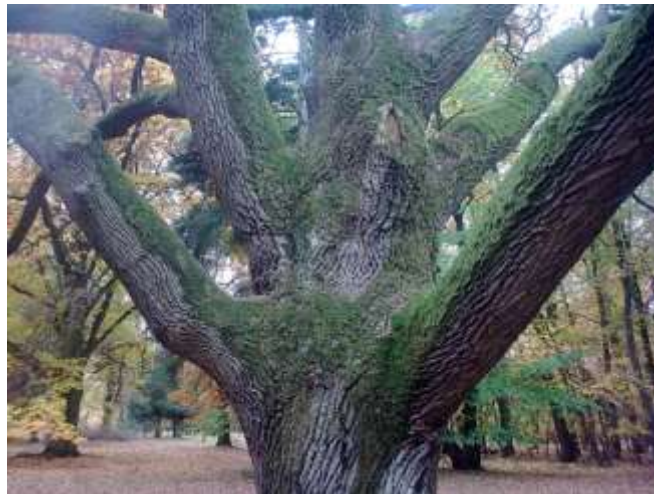
Szarvasi arborétum tölgyfája

Ha mindezt figyelembe venném, akkor rengeteg szépnek titulált fát találnák a városban, és körülötte.